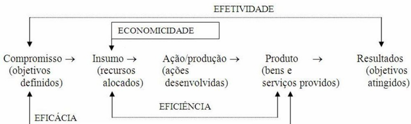
Diagrama de insumo-produto

Fonte: Adaptado de ISSAI 3000/1.4, 2004.