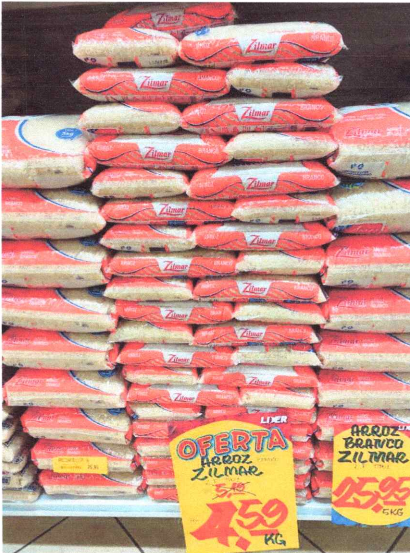
Imagem 3 – Item 05 – Arroz Parboilizado Tipo 1.

Endereço: Tv. Floriano Peixoto, 1391 - Centro, Castanhal - PA, 68743-030