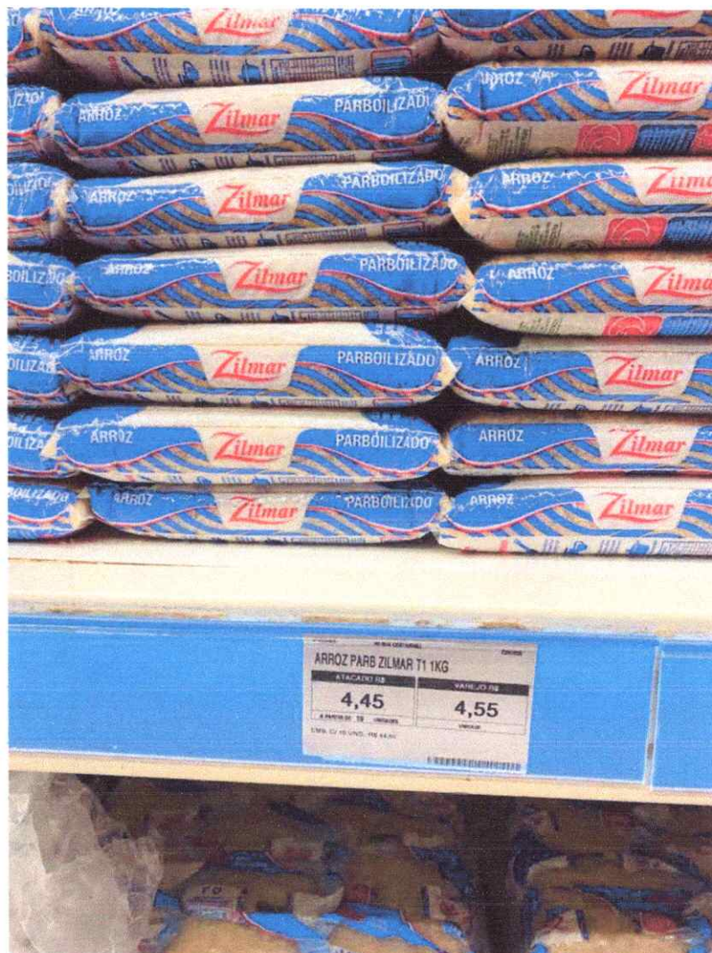
Imagem 5 – Item 05 - Arroz Parboilizado tipo 1

Endereço: Av. Barão do Rio Branco - Centro, Castanhal - PA