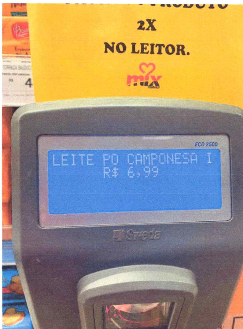
Imagem 6 – Item 76 – Leite em pó integral, 1kg, no momento não tinha o preço no expositor do estabelecimento e nem o produto de 1 kg, cálculo realizado para o KG (R$ 6,99x5= 34,95).