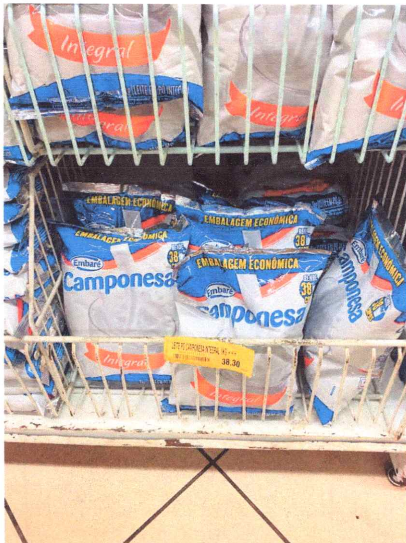
Imagem 4 – Leite em pó integral, 1 Kg