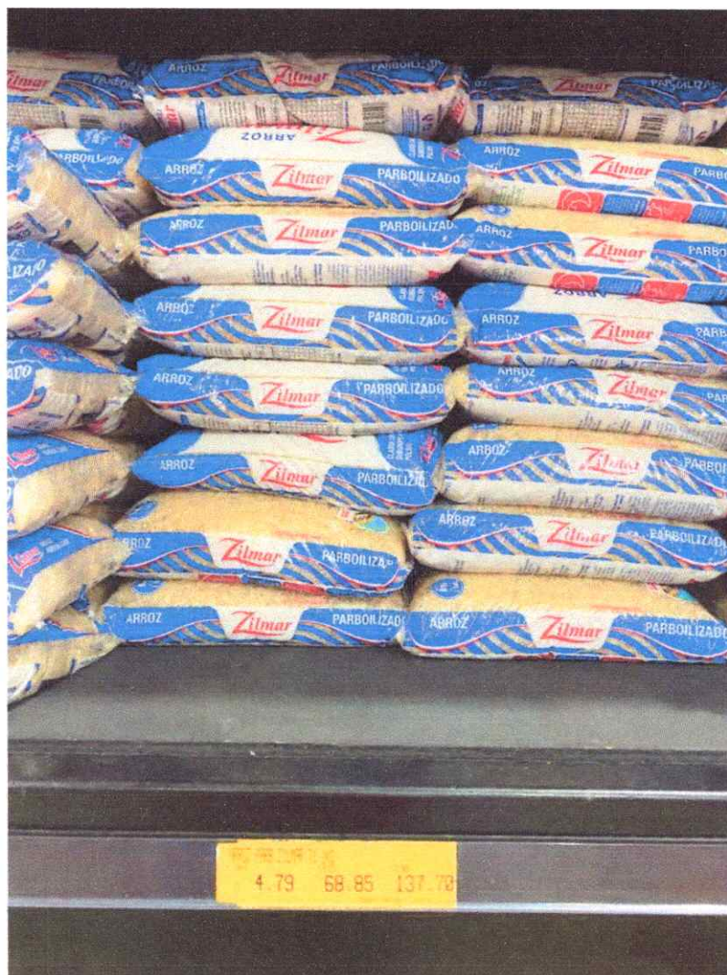
Imagem 1 – Item 05 – arroz parboilizado tipo 1, não foi encontrado no estabelecimento o arroz na marca Gama Lopes, como consta na solicitação, foi utilizado marca similar.

Endereço: Tv. Benjamin Constant, 450 - Centro, Castanhal - PA, 68770-000