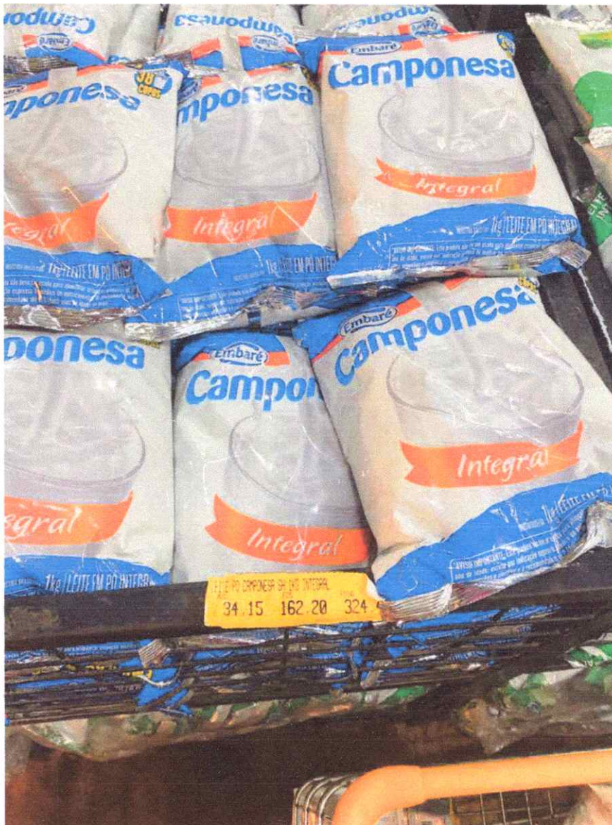
Imagem 2 – Item 76 – Leite em pó integral, 1Kg.