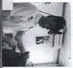
Home de Salinas