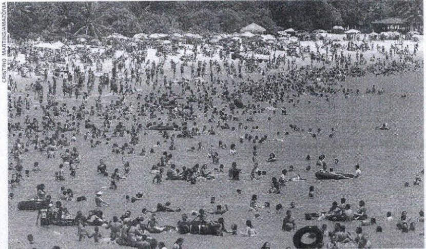
■ O domingo foi de diversão nas praias de Mosqueiro, que foram a escolha de milhares de veranistas

No calçadão das praias do Chapéu Virado e Farol foram revitalizados os espaços para prática de esportes, como equipamentos de academia ao ar livre; quadra de vôlei; rampa de skate e outros.