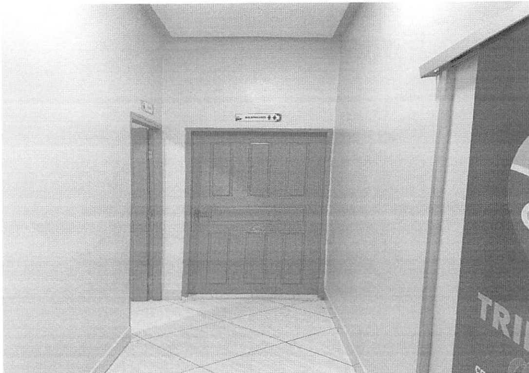
Corredor com acesso a copa, banheiro e salas de atendimento.