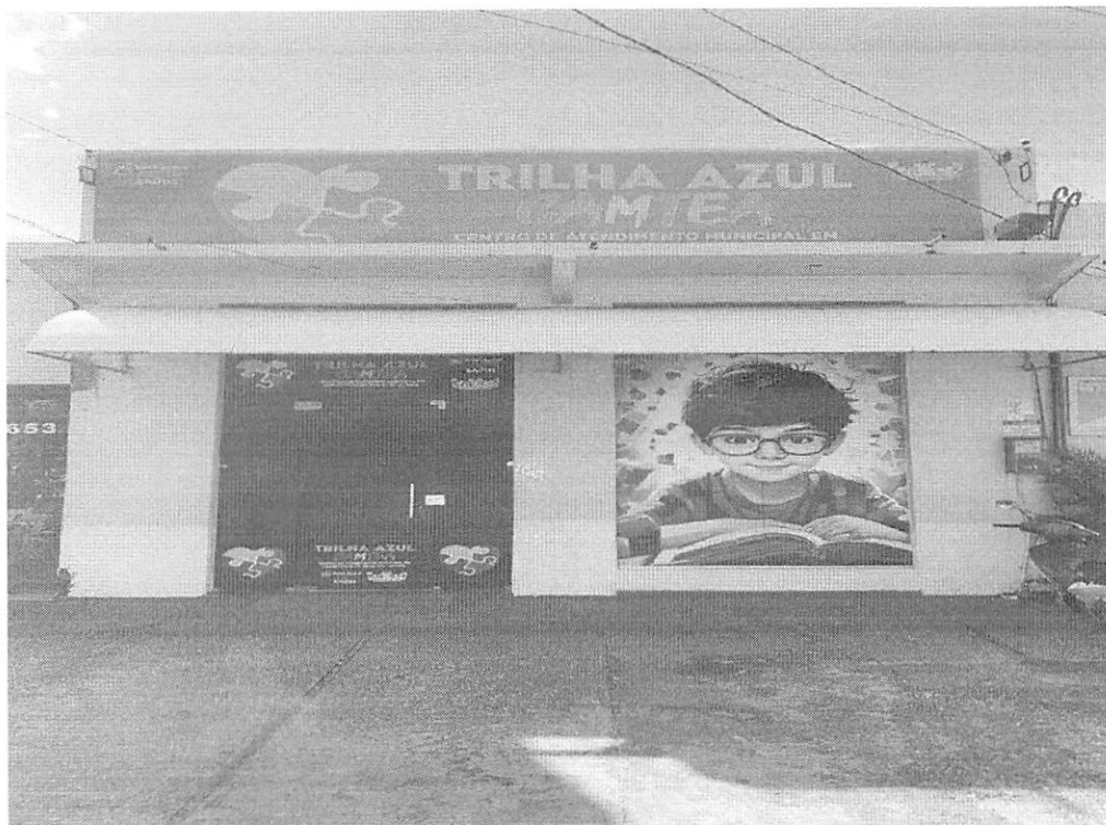
Fachada com acesso a área de entrada.