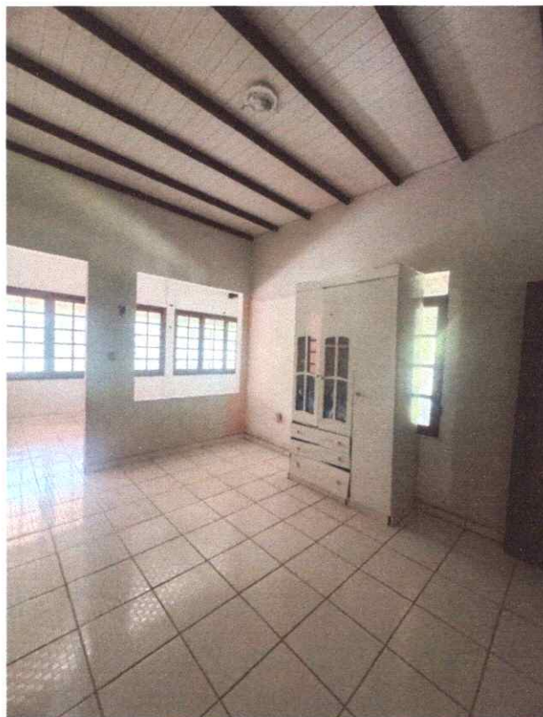
Figura 4 – Quarto