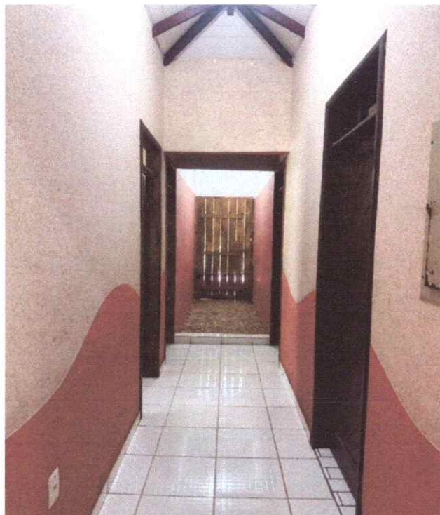
Figura 2 – Corredor