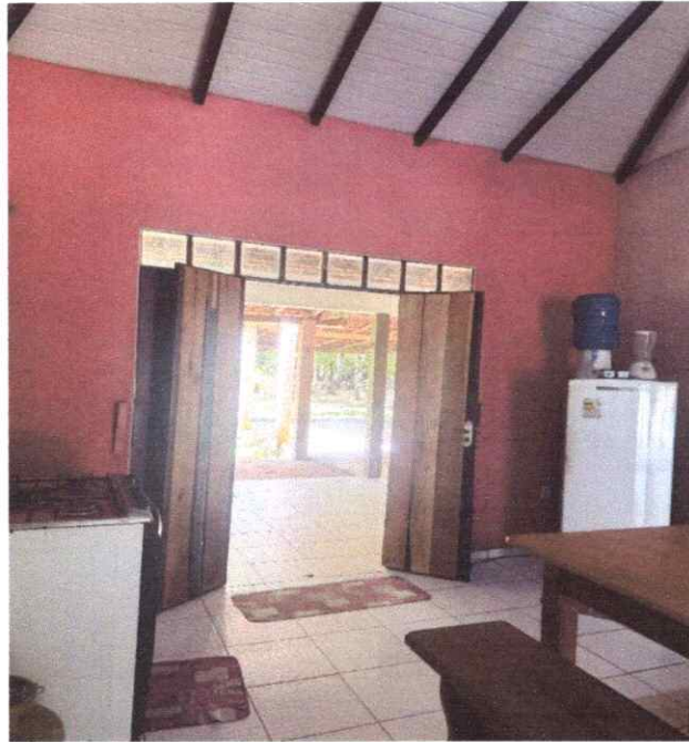
Figura 3 – Cozinha