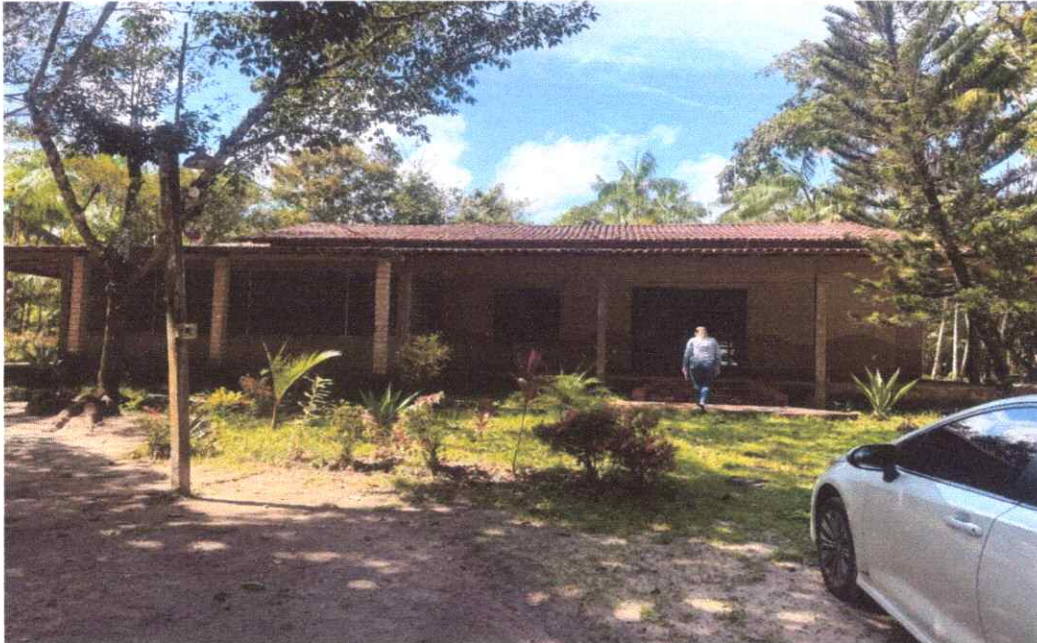
Figura 1 - Fachada Principal