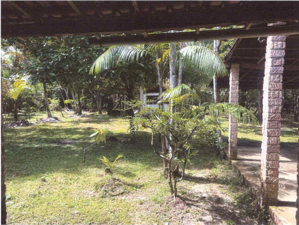
Figura 5 – Área livre