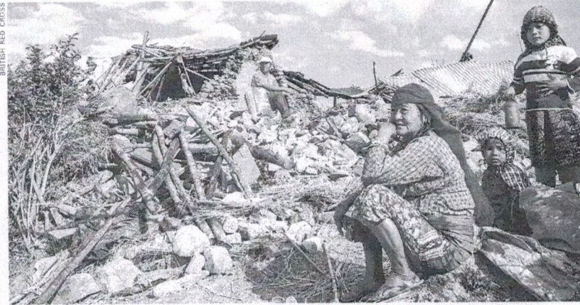
■ De acordo com a ONU, o terremoto de magnitude 7,8 afetou 8 milhões de nepaleses