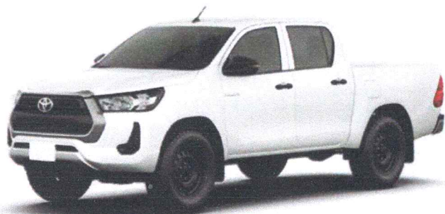
HILUX CD STD POWER PACK AT 4X4 DIESEL 2025

CLIENTE: Prefeitura Municipal de Novo Progresso