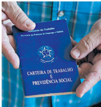
A justa causa representou 2,6% do total de termos de contrato em 2025.

É um movimento que se acentuou nos últimos cinco anos e que é estimulado por uma tempestade perfeita: a combinação de alta rotatividade, maior vigilância dos empregadores