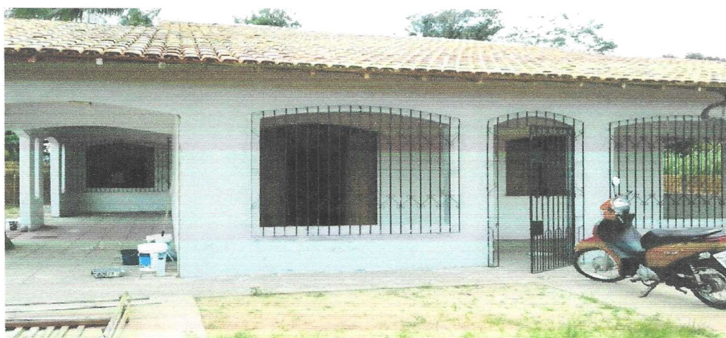
Imagem 02 – Vista Frontal do Imóvel .