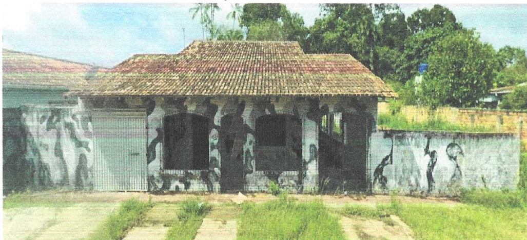
Imagem 01 – Imóvel, 1°07'35.4"S 47°37'06.6"W.

Foram observados todos os trechos dos vãos e não foram identificados nenhum dano da cobertura e no telhado na edificação.