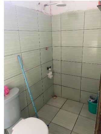
IMAGEM 08: BANHEIRO DO PAVIMENTO TÉRREO.