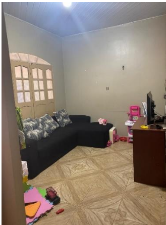
IMAGEM 03: SALA DE ESTAR.