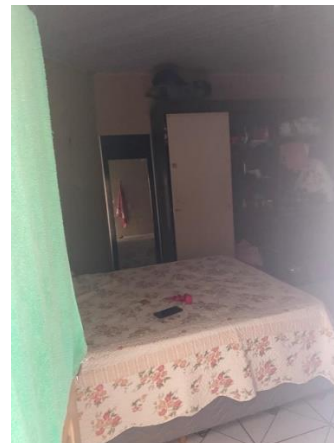
IMAGEM 06: QUARTO 03.