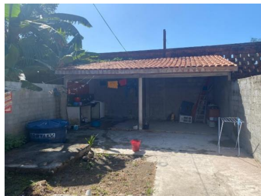
IMAGEM 10: ÁREA EXTERNA.