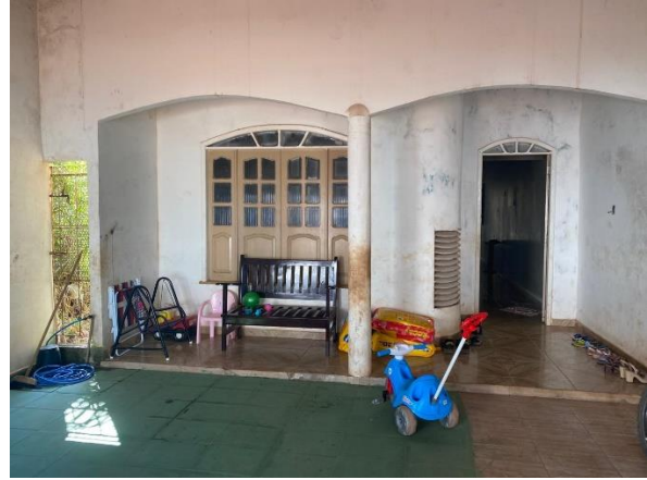
IMAGEM 02: GARAGEM E HALL ENTRADA.