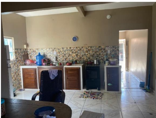
IMAGEM 09: COZINHA.