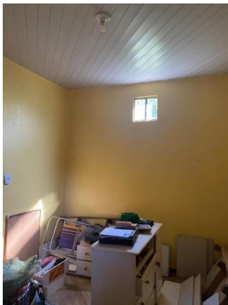
IMAGEM 05: QUARTO 02.