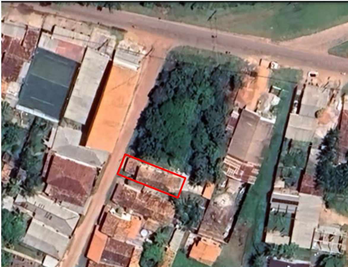
Imagem 01.