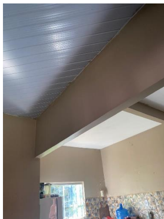
IMAGEM 11: FORROS COM ACABAMENTOS VARIADOS.