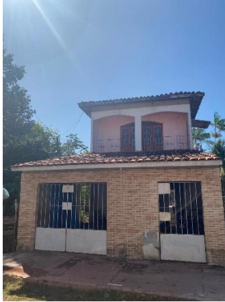
IMAGEM 01: FACHADA PRINCIPAL DO IMÓVEL.