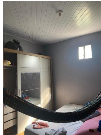
IMAGEM 04: QUARTO 01.