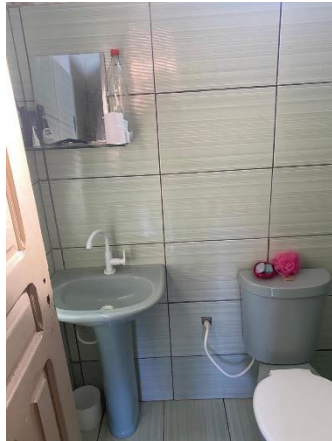
IMAGEM 07: BANHEIRO DO PAVIMENTO TÉRREO.