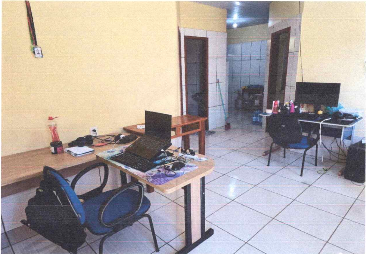
IMAGEM 03 – SALA / CIRCULAÇÃO ENTRE AMBIENTES.