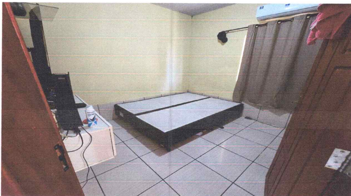
IMAGEM 04 – DORMITÓRIO 01.