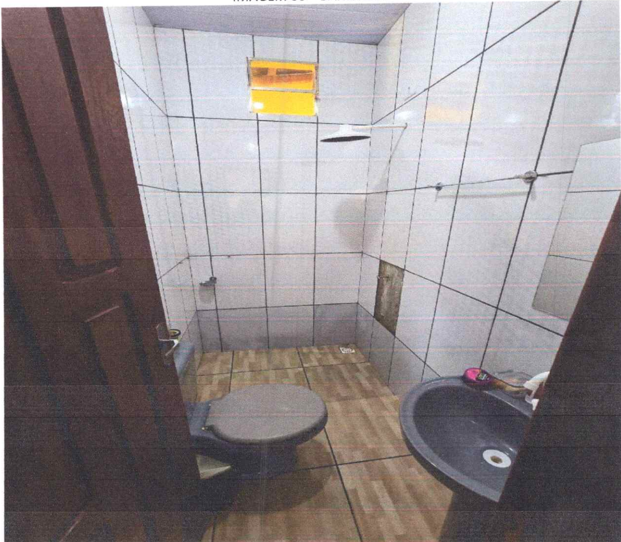
IMAGEM 06 – BANHEIRO.