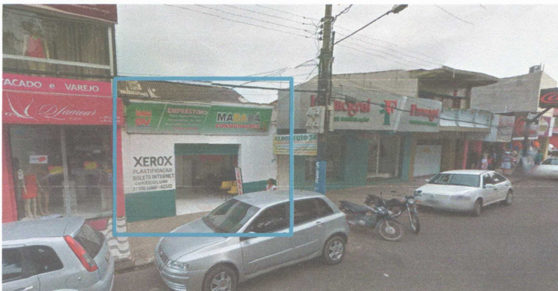
Foto do Imóvel 1

Imóvel comercial de 144m 2 , com salão comercial, banheiro, dois ambientes e área construída nos fundos. O valor de locação na data do laudo de avaliação é de R$ 2.600,00 (dois mil e seiscentos reais). O valor do m 2 da área construída R$ 18,05 (dezoito reais e cinco centavos).