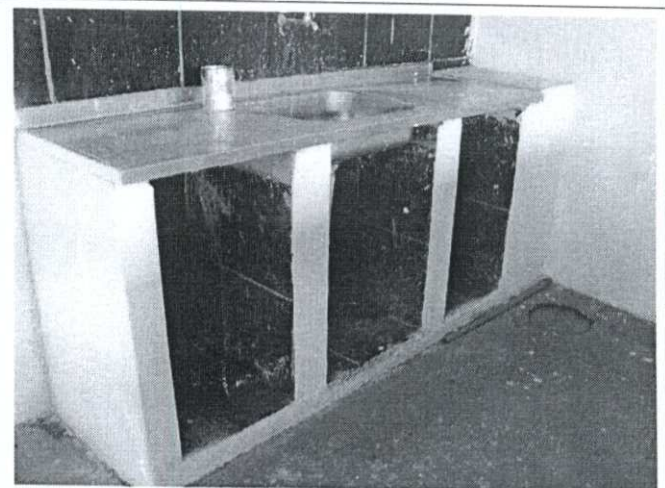
Imagem 04: área da cozinha.