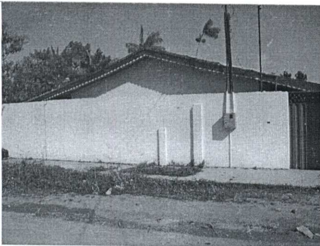
Imagem 03: Fachada Frontal;