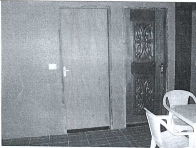
Imagem 01: Vista interna da edificação;