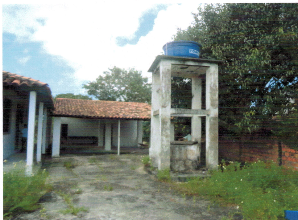
Vista - Lateral garagem

A small, handwritten blue mark or signature located at the bottom right of the page.