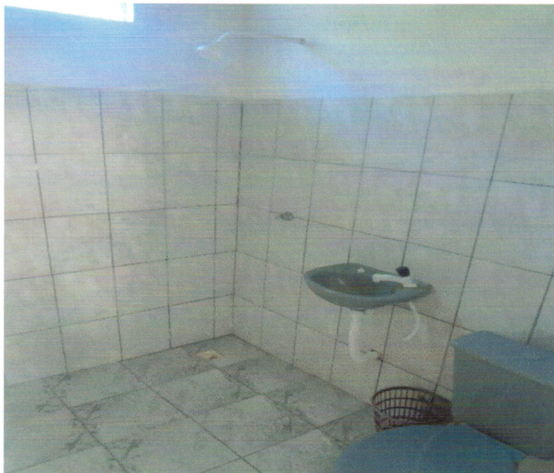
Vista interna – Banheiro externo