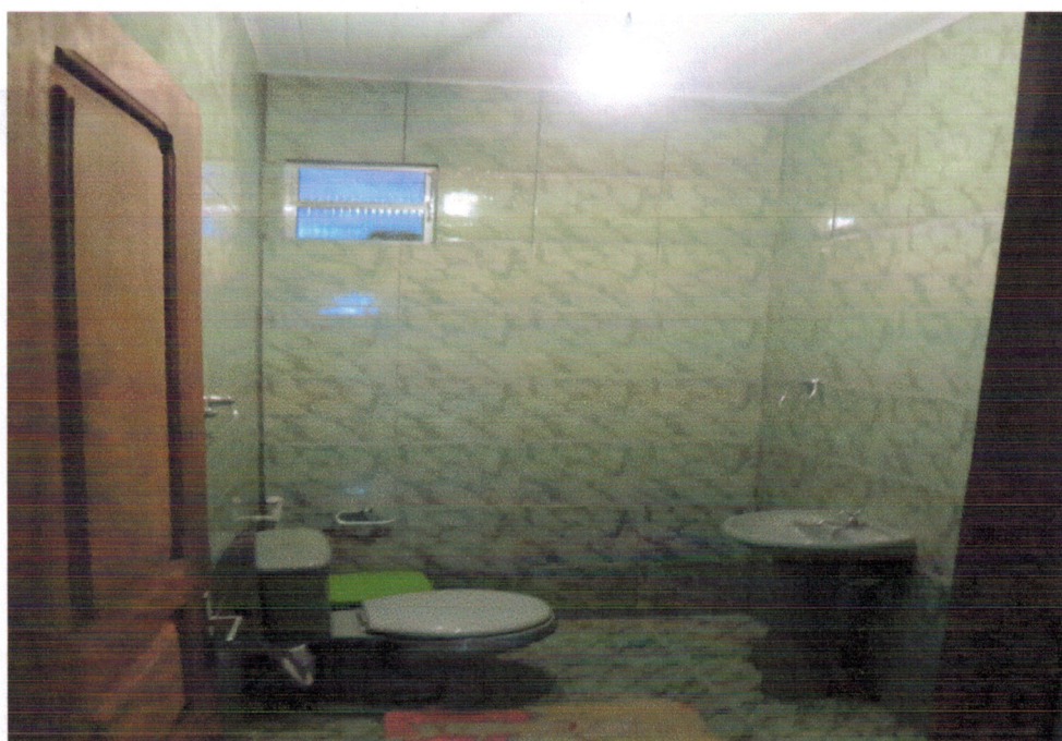
Vista interna - Banheiro