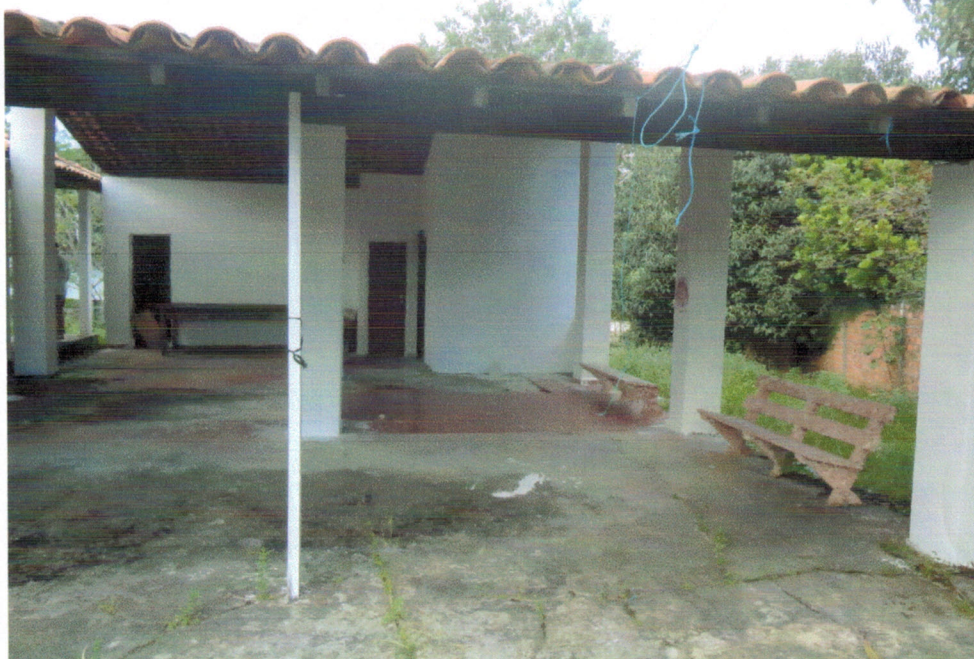
Vista - Garagem