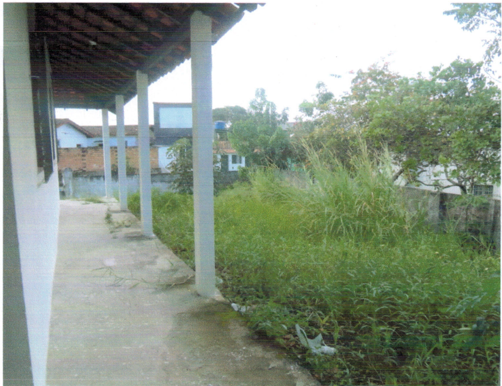
Vista externa - Circulação