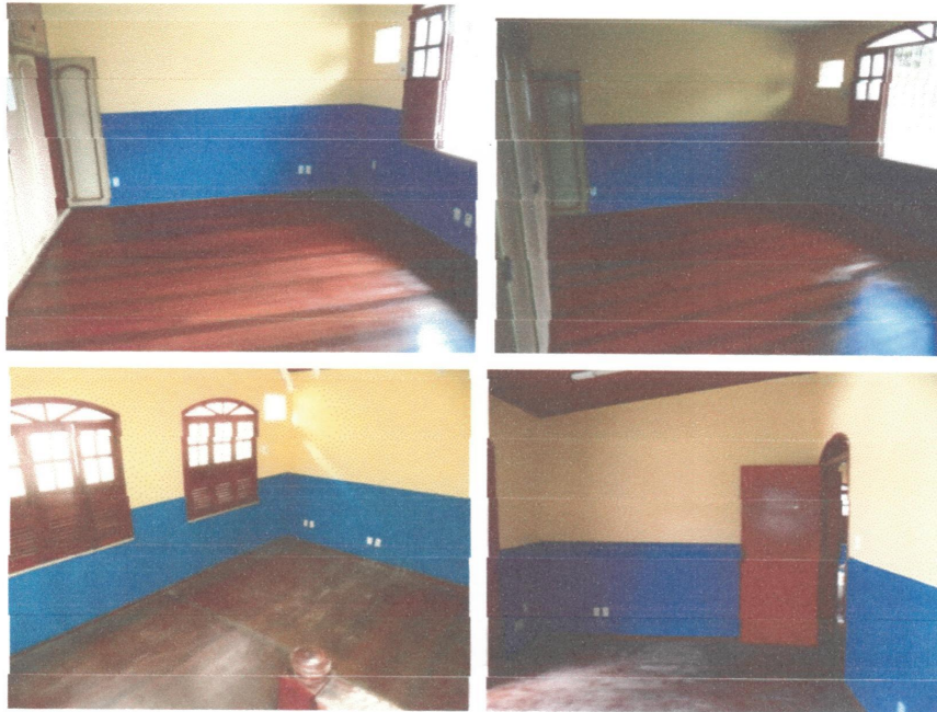
Quartos com piso e rodapés em madeira, paredes emassadas e pintadas, forro madeira.