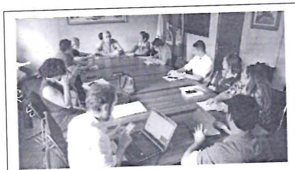
Figura 3: Reunião com Prefeito Municipal, Equipe de gestão e Representantes dos Supermercados e Atacarejos para pedir apoio às medidas do Decreto nº 24/2020 e à Assistência Social.