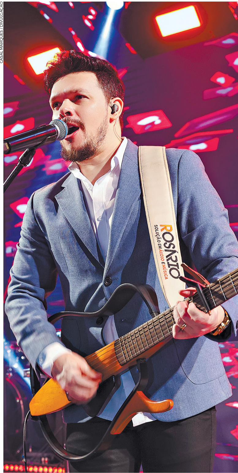
Cantor Thiago Costa grava músicas do que chama de "sertanejo do Norte" em novo trabalho