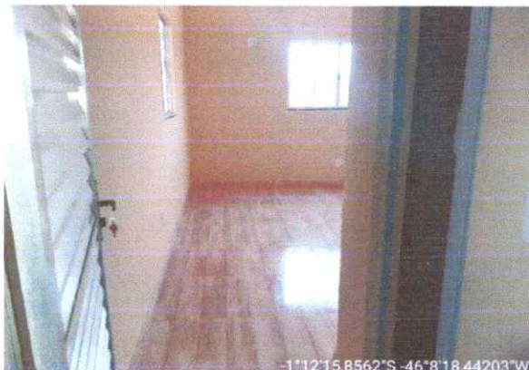
Imagem 03: Sala