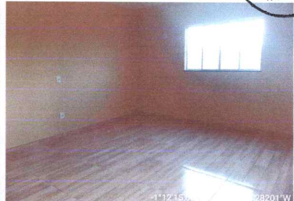
Imagem 02: Sala