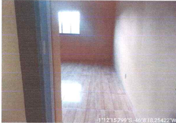
Imagem 01: Sala