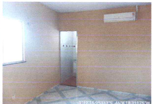
Imagem 06: Sala e acesso a banheiro