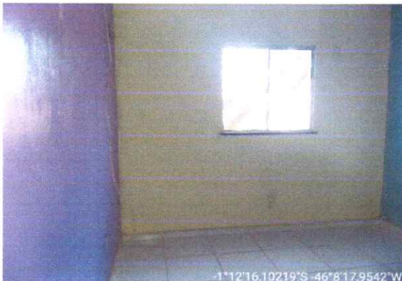
Imagem 05: Sala