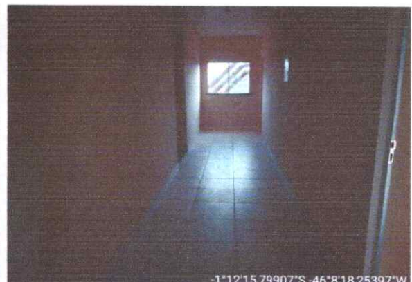
Imagem 04: Corredor