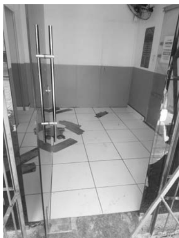
ENTRADA SALA PRINCIPAL