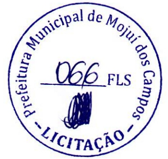
Imagem (316).jpg ~772 KB