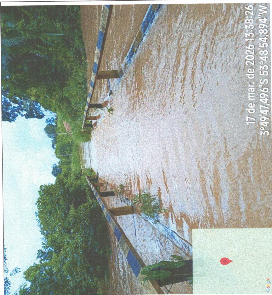
Transporte sendo realizado por canoa (ponte ao lado direito da foto)

17 de mar. de 2026 13:38:26 3°49'47,496"S 53°48'54,894"W