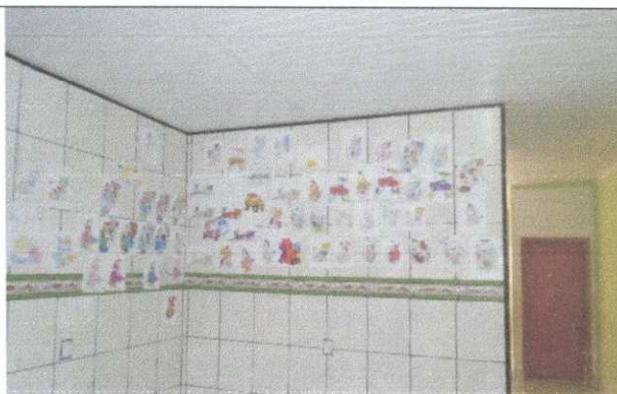
Imagem 04: VISTA FRONTAL;