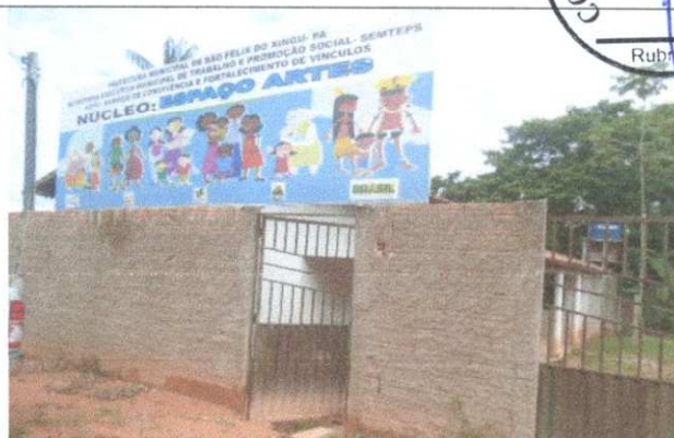
Imagem 02: VISTA FACHADA;