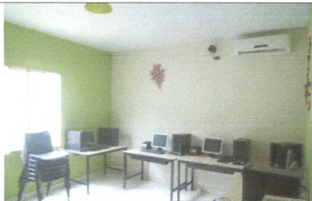
Imagem 01: VISTA INTERNA;