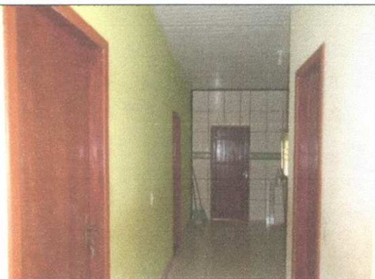
Imagem 03: VISTA INTERNA;