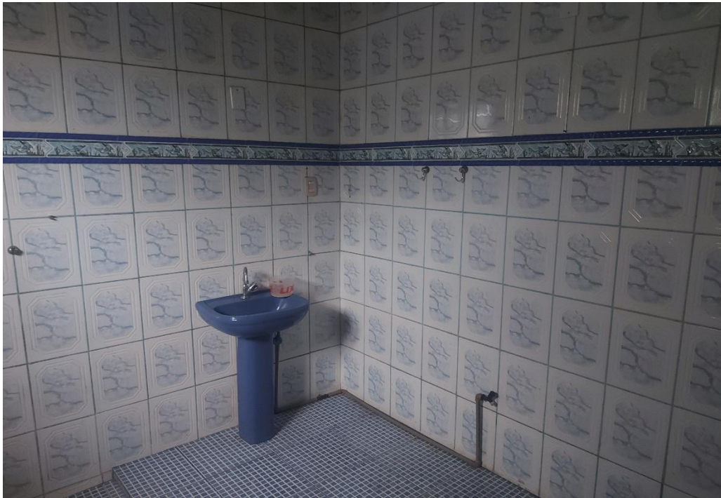
Figura 5: vista do banheiro.