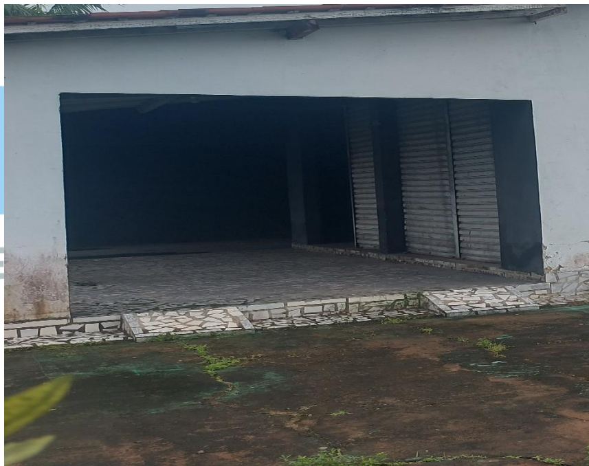
Figura 10: vista do pátio.