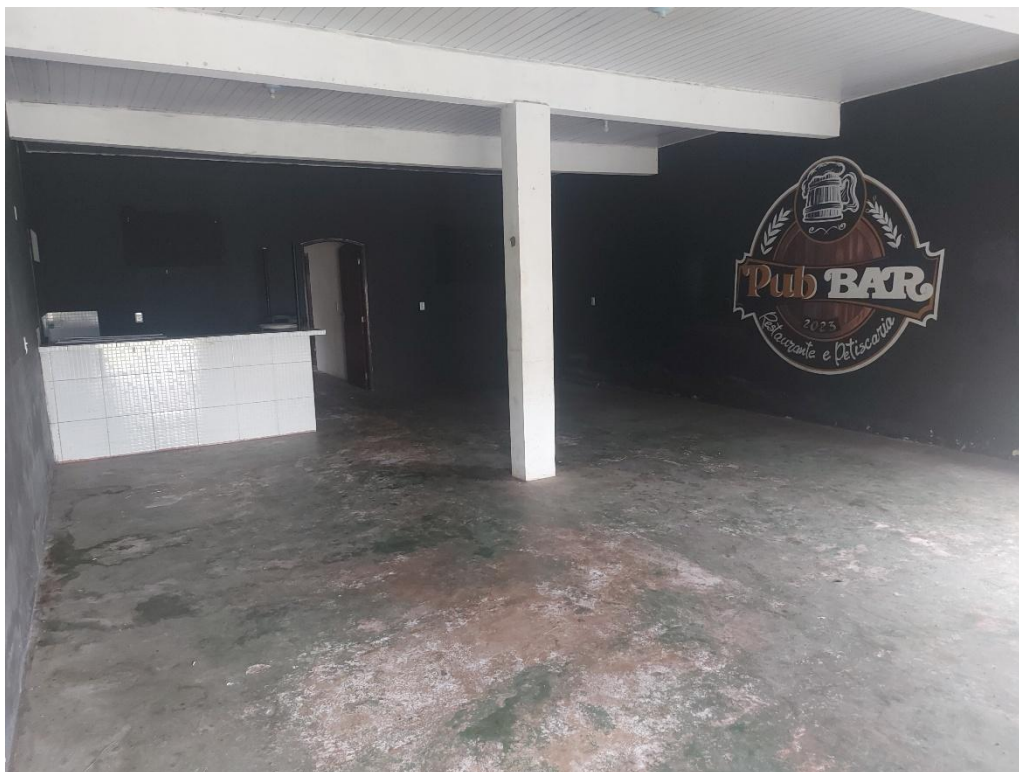
Figura 1: Vista do salão.