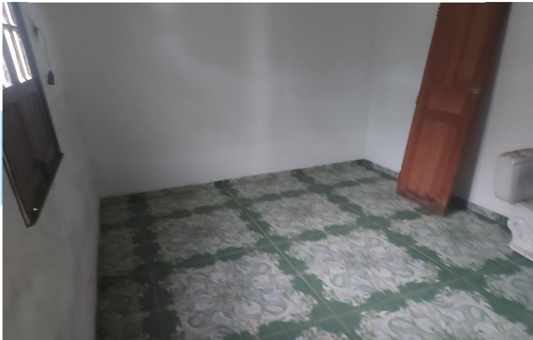
Figura 4: vista da sala 01.

End.: Rua Frei Daniel de Samarate, 128 Centro - Santarém Novo - PA CEP: 68720-000