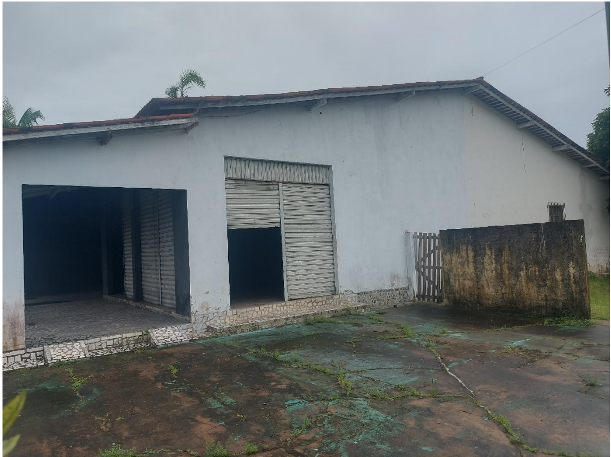
Figura 9: Vista da fachada esquerda.