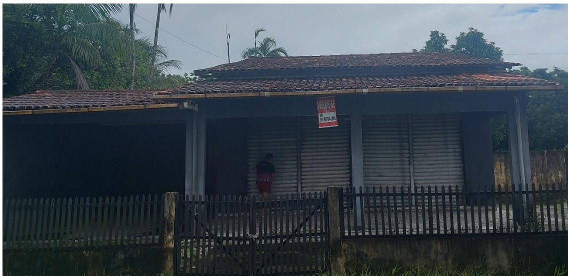
Figura 11: vista do pátio.