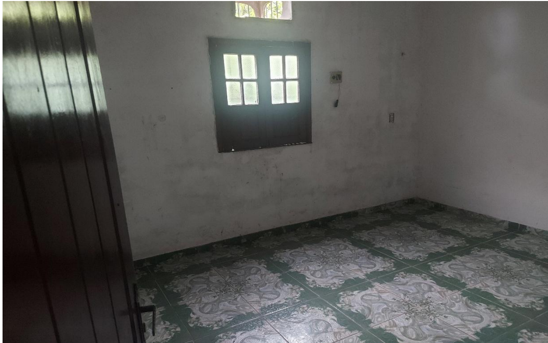
Figura 3: Vista da sala 01.