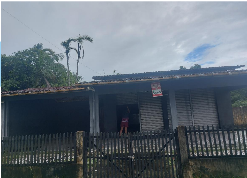
Figura 8: Vista da fachada frontal.

End.: Rua Frei Daniel de Samarate, 128 Centro - Santarém Novo - PA CEP: 68720-000