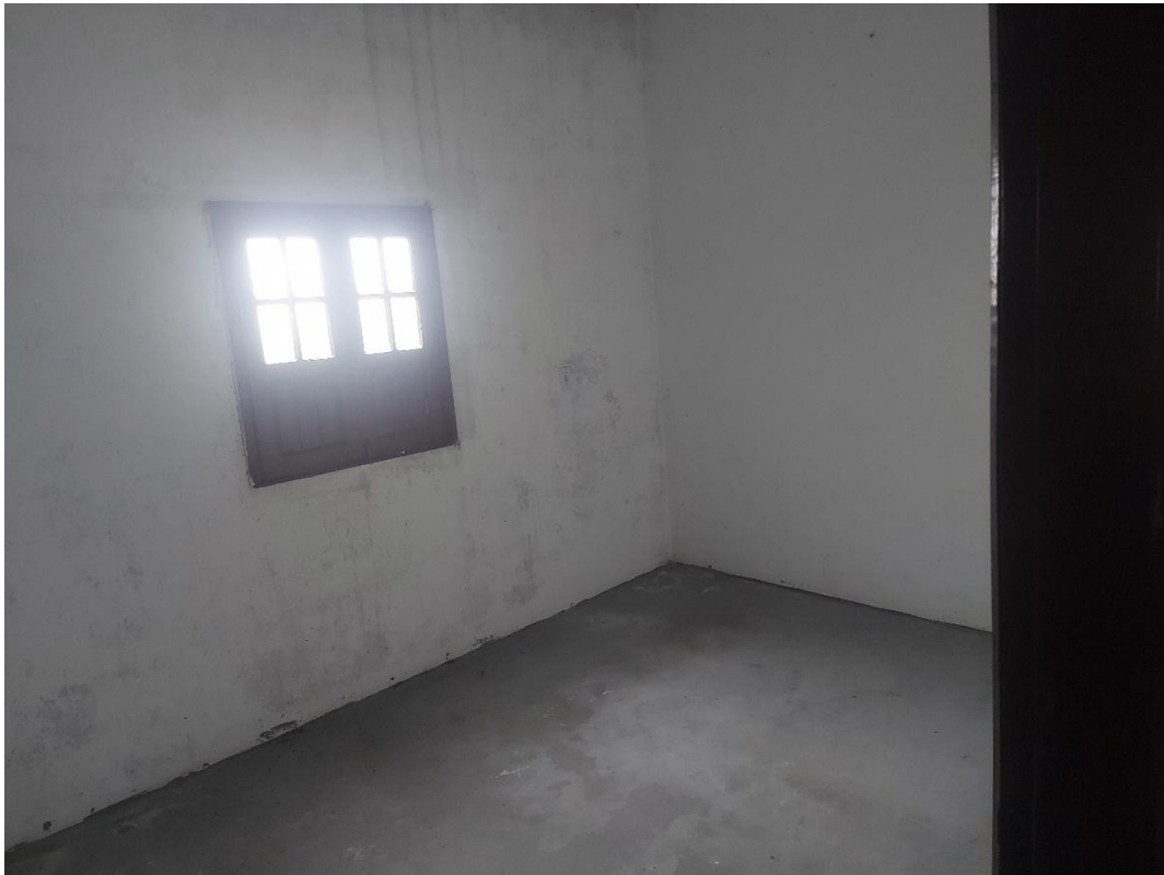
Figura 7: Vista da sala 02.