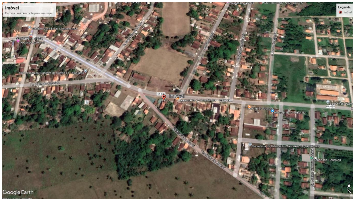
Imagem 01: Planta de localização do imóvel vistoriado.

Endereço: Av. Francisco Martins de Oliveira, sem número, Bairro: Liberdade, CEP: 68.720-000, Santarém Novo/PA.