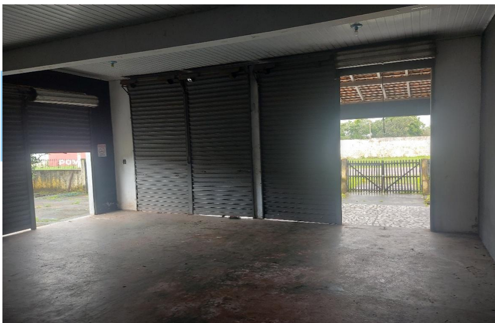
Figura 2: Vista do salão.