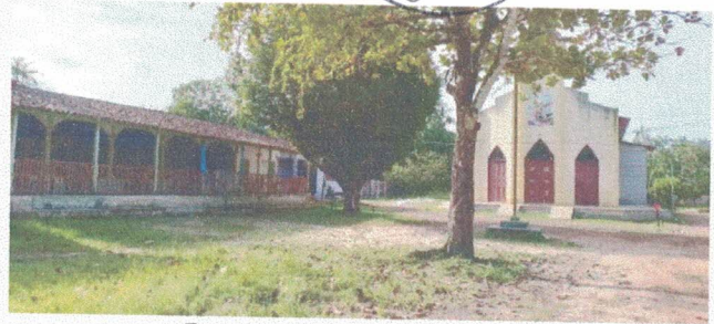
Imagem 2 - Acesso a escola