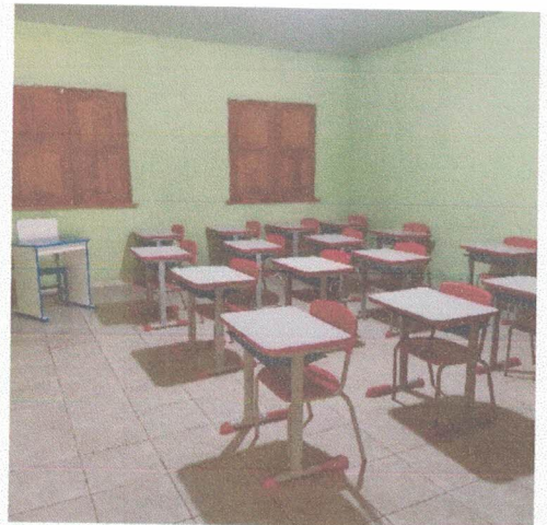
Imagem 6 - Sala de Aula