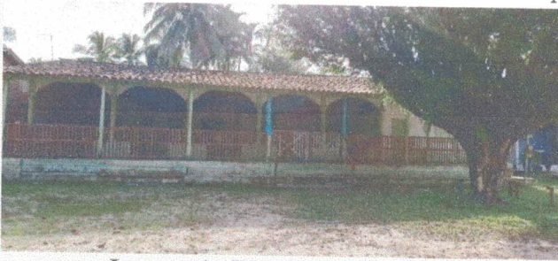
Imagem 1 - Vista Frontal (Escola)