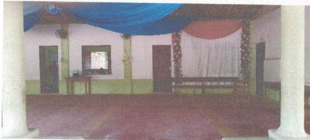
Imagem 3 - Área de recreação