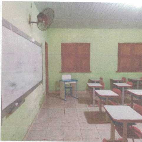
Imagem 5-Sala de Aula