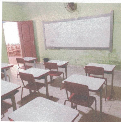
Imagem 7- Sala de aula