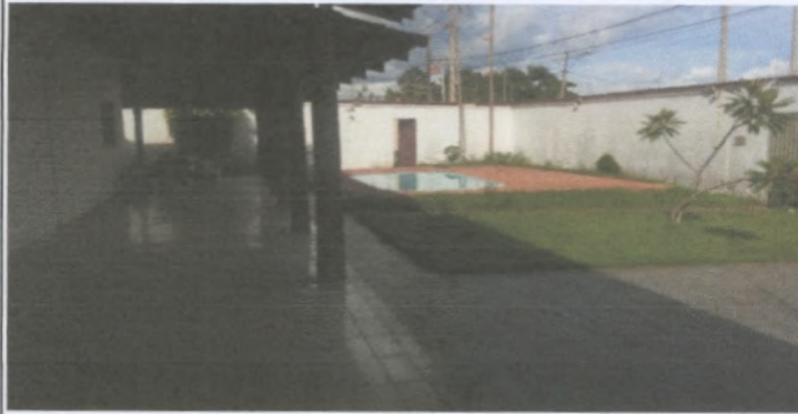
Foto 01 - Área externa

COMISSÃO PERMANENTE DE LICITACÃO RS 2017