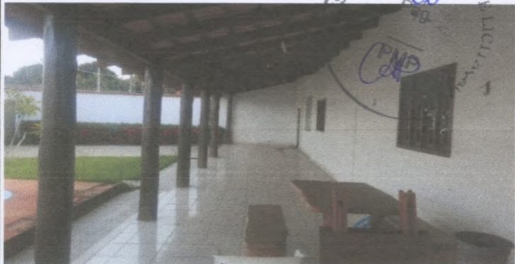
Foto 8 - Varanda

COMISSAO PERMANENTE DE LICITACAO 06 PMP 2019