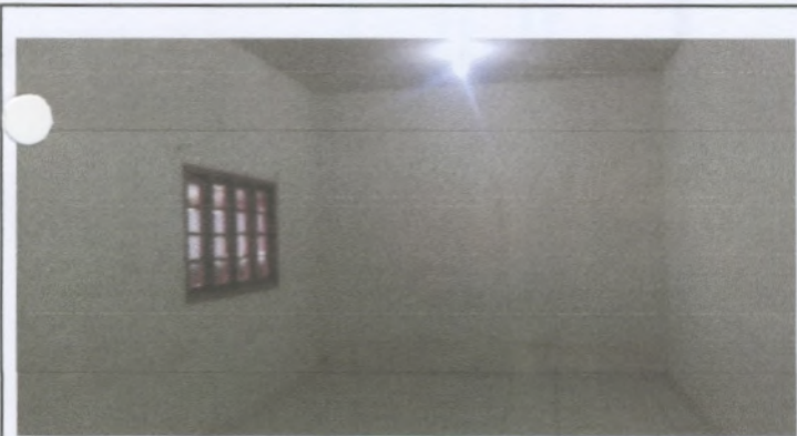
Foto 05 - Sala