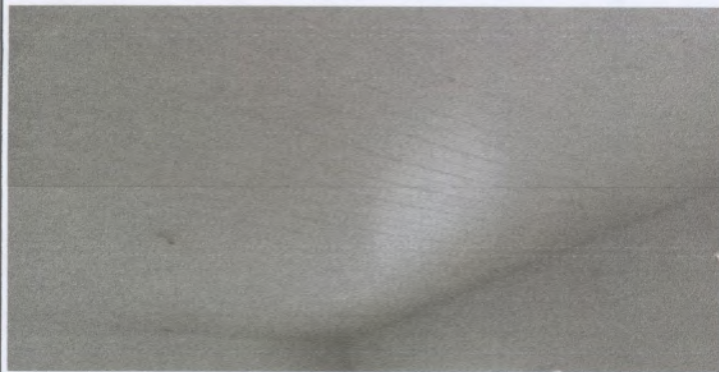
Foto 07 - Forro