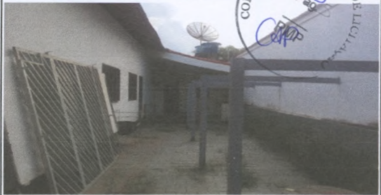
Foto 02 - Área de Serviço