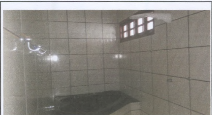
Foto 06 - Banheiro/suíte