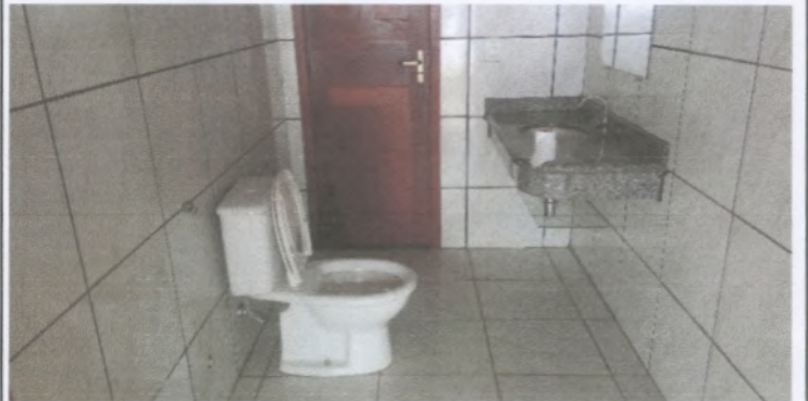
Foto 04 - Banheiro Com entrada externa/interna