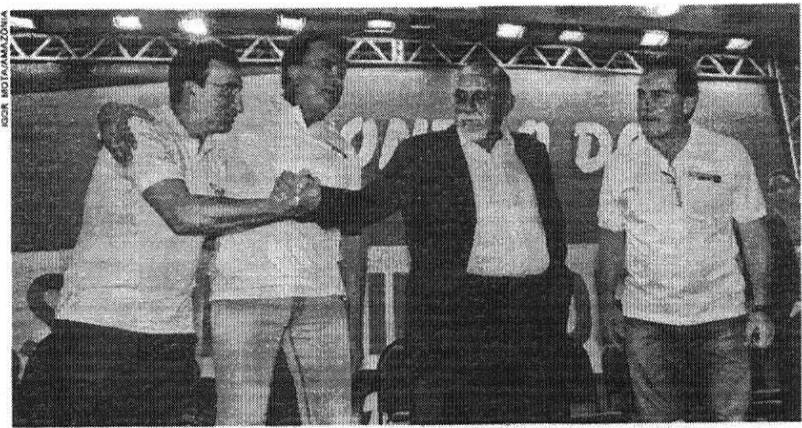
Simão Jatene com políticos do Solidariedade no primeiro encontro estadual da sigla no Pará

agradeceu o apoio do Solidariedade. "Esse partido nasce grande pela sua militância, pela sua determinação", elogiou. Jatene também destacou a importância da união entre os que têm o mesmo interesse.