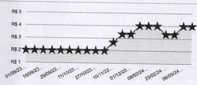
Tabela: Tabela CEASA Produto: REPOLHO Data: 08/03/2024 UF: RJ Unidade: KG Preço Atacado: Não

Preço CEASA/CONAB 1 R$ 4,00 Inc. III Art. 5º da LN 65 de 07 de Julho de 2021 (Lei nº 14.133)