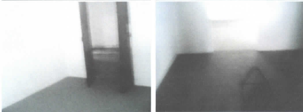
SALA E DORMITÓRIO