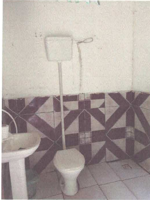
Imagem 06 – WC 01

Declaramos sob a pena da lei, que o imóvel descrito em conformidade com o LAUDO acima, atende as condições abaixo: