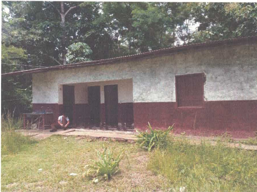
Imagem 01 – Fachada Frontal