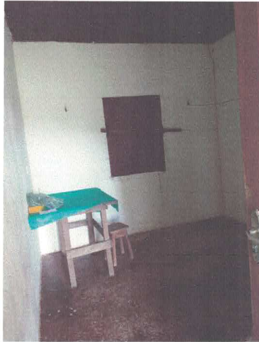
Imagem 02 – Sala