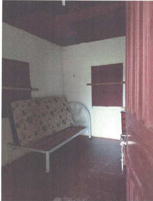
Imagem 04 – Quarto 01