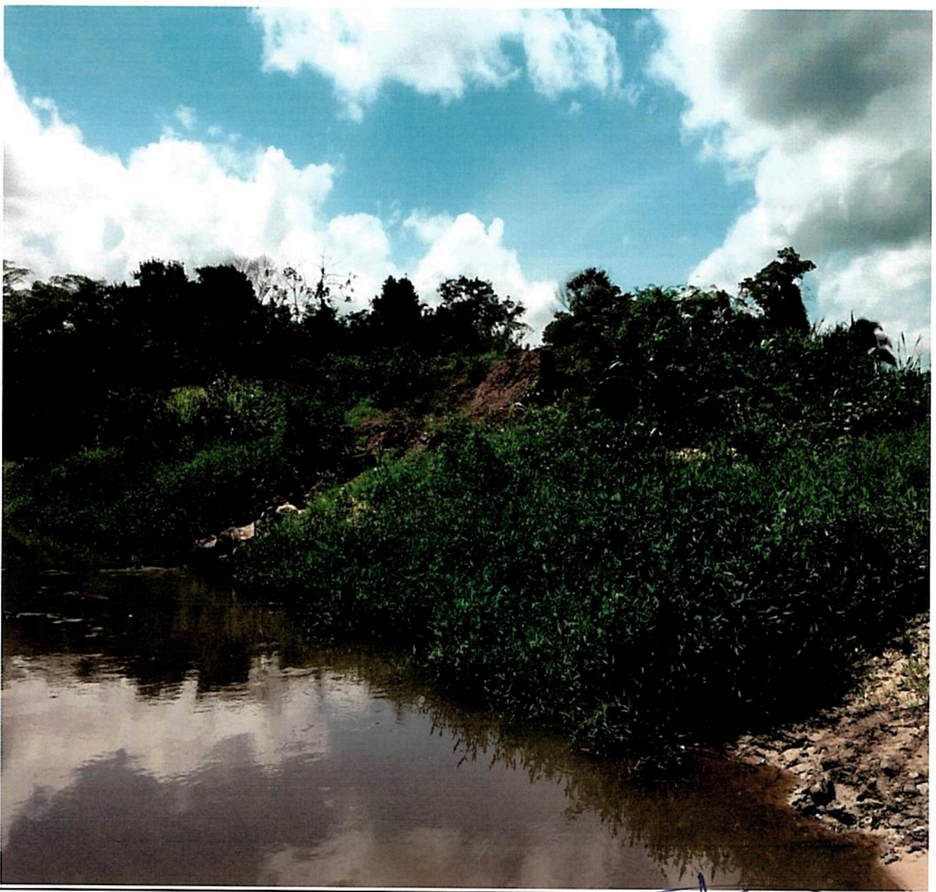
Imagem(1) córrego popularmente conhecido como "grotão" localizado na estrada vicinal VE-3 no município de Canaã dos Carajás – PA, evidenciando a inexistência de ponte no local.

A nova construção de obra de arte especial ira proporciona o perfeito atendimento das necessidades diárias da população de forma geral encurtando as distâncias e vencendo os obstáculos criados pela retirada da antiga estrutura incendiada, onde desde tempos remotos o Homem necessita de ultrapassar obstáculos em busca de alimento ou abrigo, e o equipamento a ser construido promovera a efetiva segurança na passagem dos veiculos de pequeno e grande porte, sanando totalmente os aneios e dificuldades aqui apresentadas e atendendo essencialmente o interesse público.