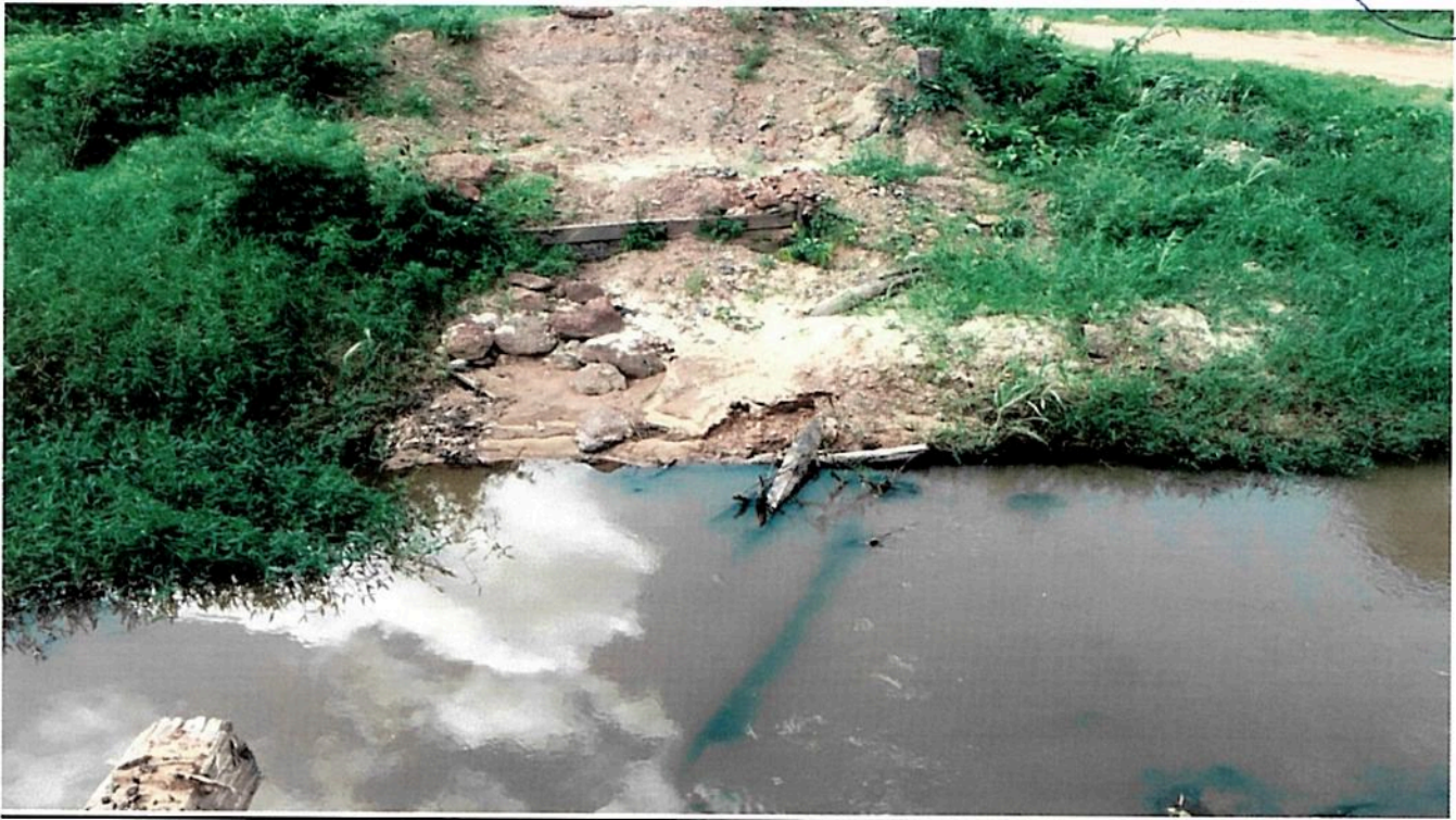
Imagem(2) extensão total da ponte a ser construída, podendo-se ver resquícios da ponte antiga constituída de estrutura de madeira.