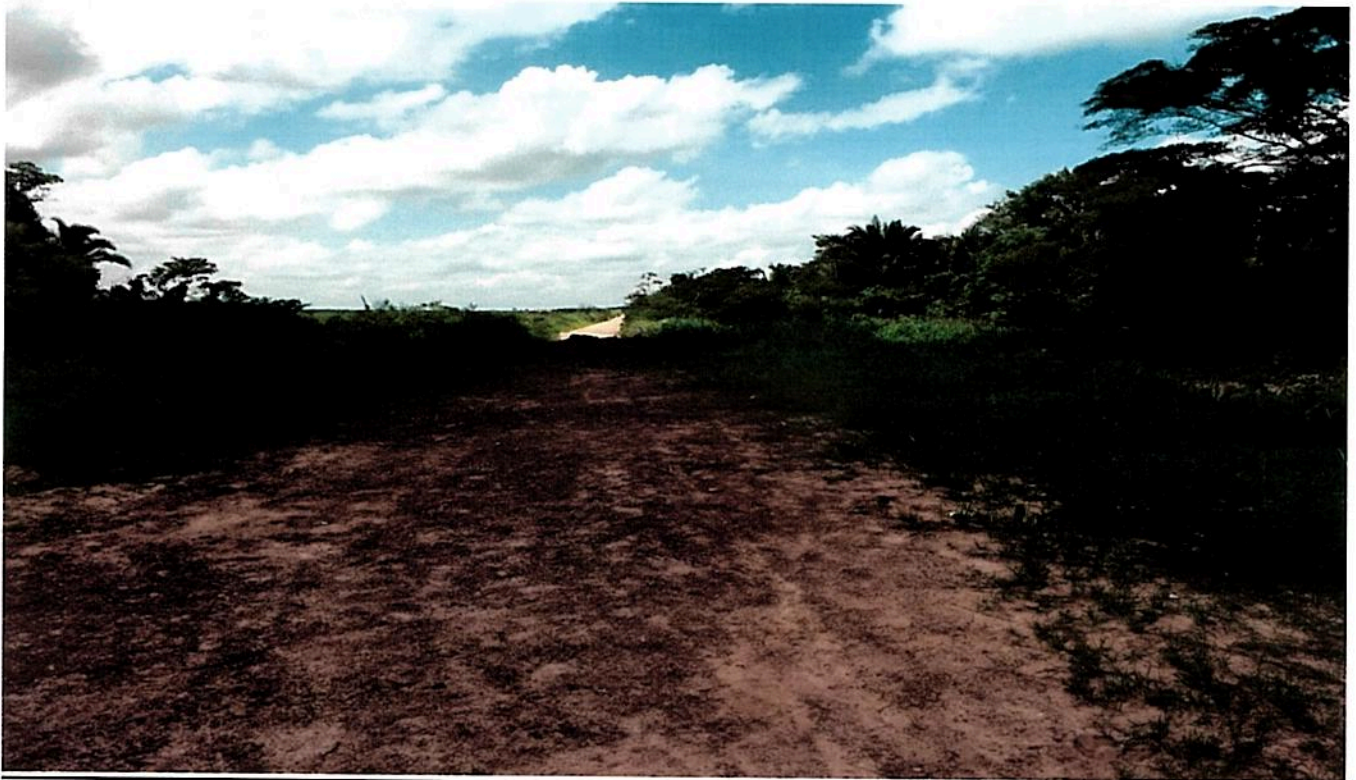
Imagem(3) Vicinal seccionada devido à falta de passagem adequada aos veículos.

Canaã dos Carajás – PA 17 de Fevereiro de 2016