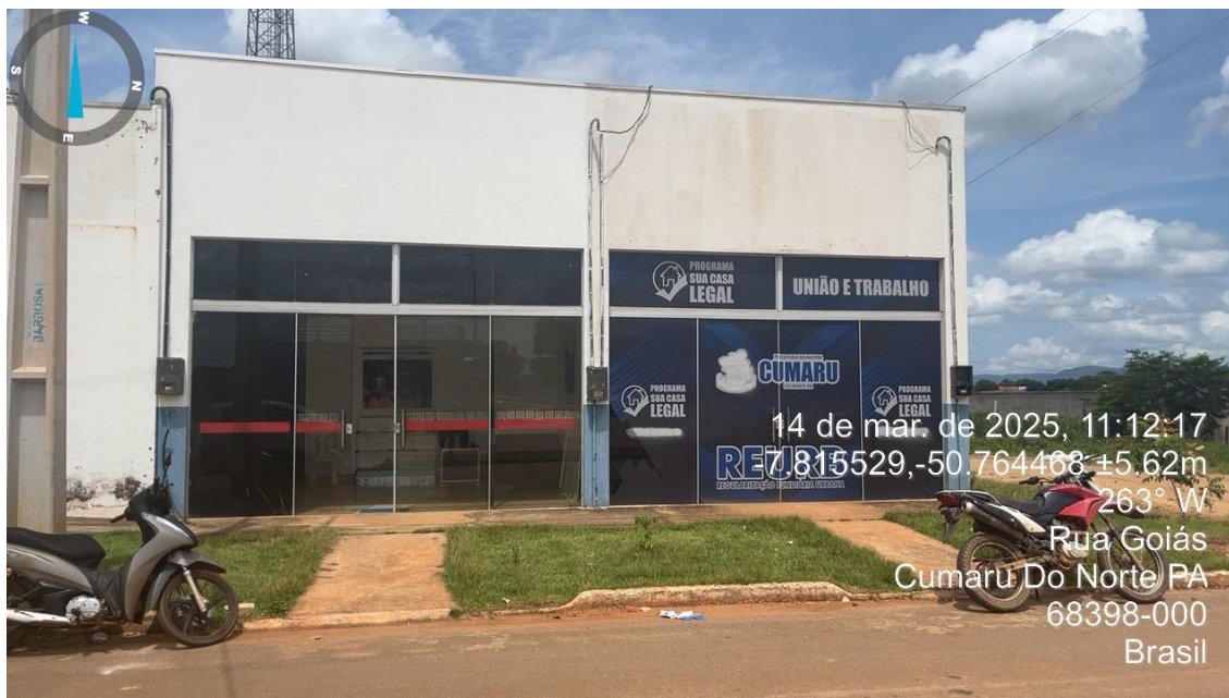
Fachada do imóvel