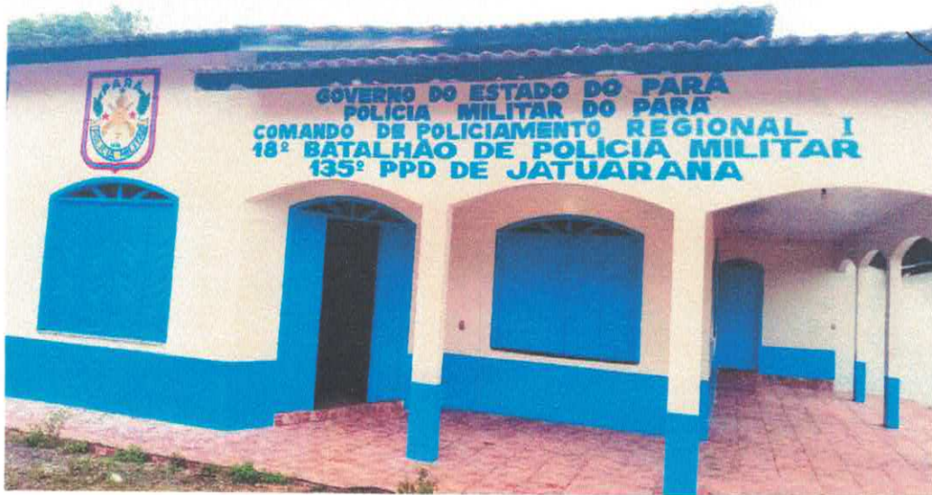
Fachada da Casa