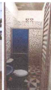
Imagem 10: Banheiro