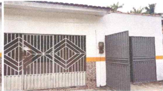
Imagem 02: Fachada