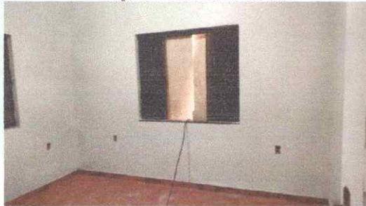
Imagem 05: Janela de vidro