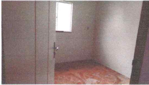
Imagem 03: Piso com revestimento cerâmico