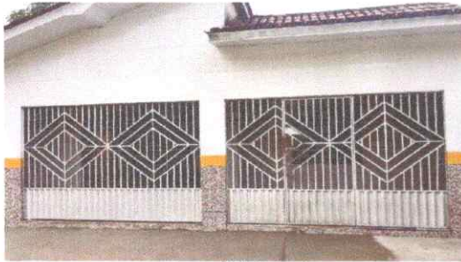
Imagem 01: Fachada