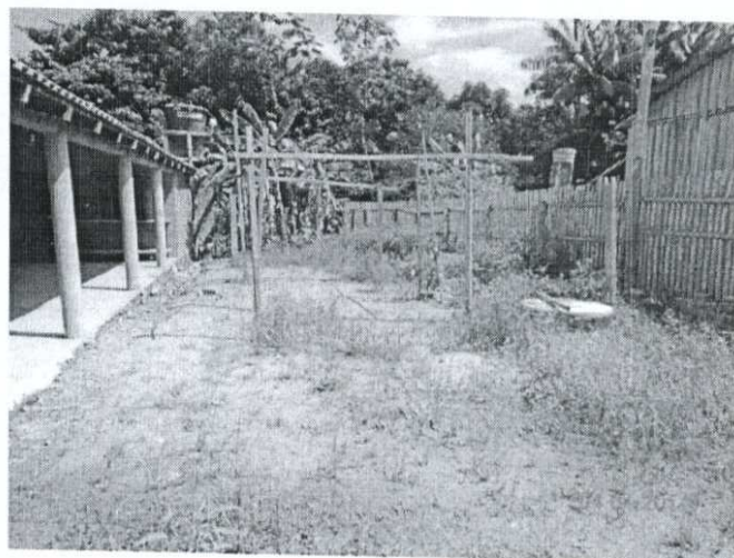
Imagem 04: Vista do poço e caixa d'água;