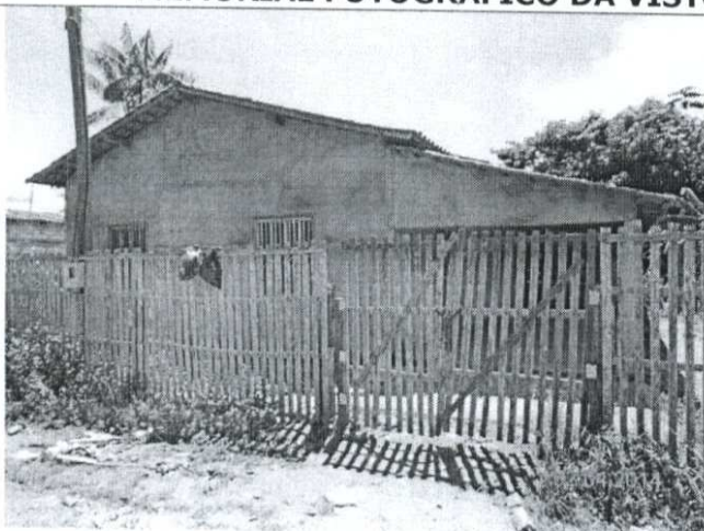
Imagem 01: Fachada frontal da edificação;