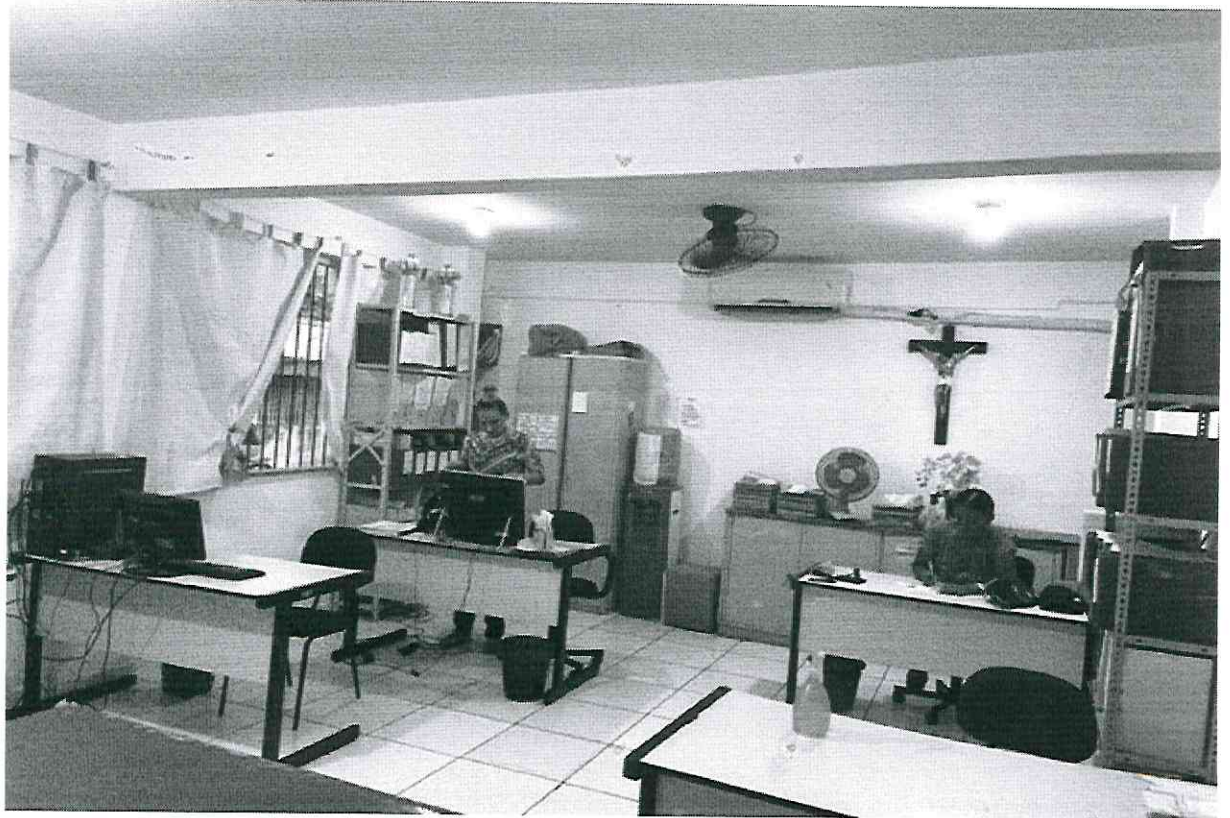
Figura 7 – Secretaria