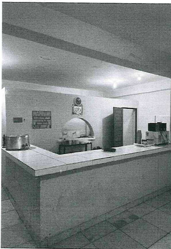
Figura 8 a 9 – Copa (Frente)