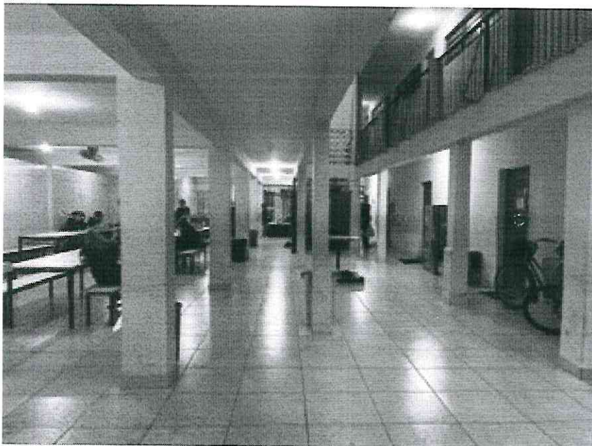
Figura 3 – Sala de aula