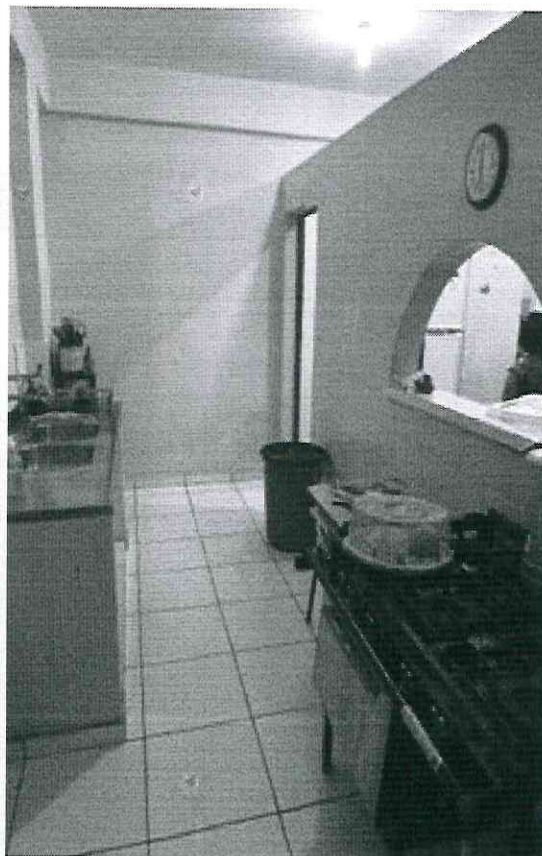
Figura 9 – Copa (Fundo)