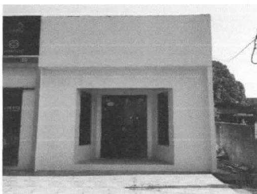
Figura 1 – Imóvel Avaliado

Imóvel está disposto com frente para a Rua das Acácias; com base no registro, seu terreno tem uma área de 900,00 m 2 , e uma edificação comercial com área de 30,00 m 2 , e está cadastrado na Prefeitura Municipal de Novo Progresso.