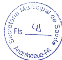
DEBORAH MAIA CRESPO Secretária Municipal de Saúde de Ananindeua