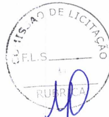
Leise Vieira de Mesquita Secretária Municipal de Educação